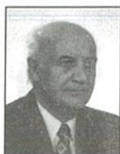
Krutilla József rajz