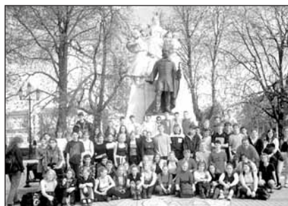
Utolsó nap délelőtt iskola, délután városnézés: együtt a magyar és a dán csapat a Kossuth téren.