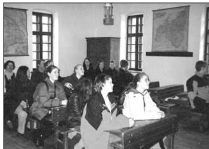
Különleges élmény volt a dán fiataloknak a Múzeumfaluban a régi iskola, akárcsak a magyar népszokások megismerése