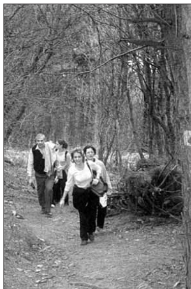
A tokaji túrából a tanárok is kivették a részüket dacolva a szinte elviselhetetlen hőséggel