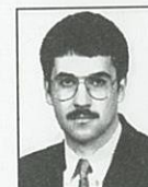
Kajatin Béla angol-ország