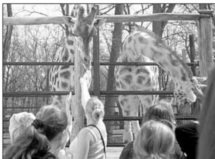
A sóstói vadasparkban a merészebbek egészen közelről tanulmányozták a kíváncsi zsiráfokat. Szerencsére az idő is nagyon szép volt